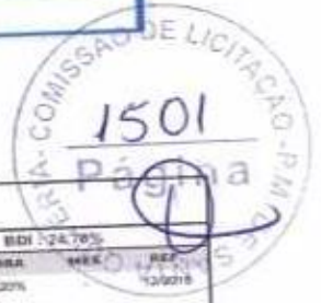
TABELA DE ENCARGOS SOCIAIS