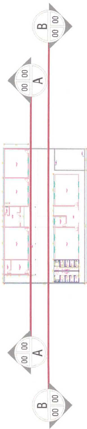
01 ELEVAT. BANDA C / MARCAÇÕES DE CORTES