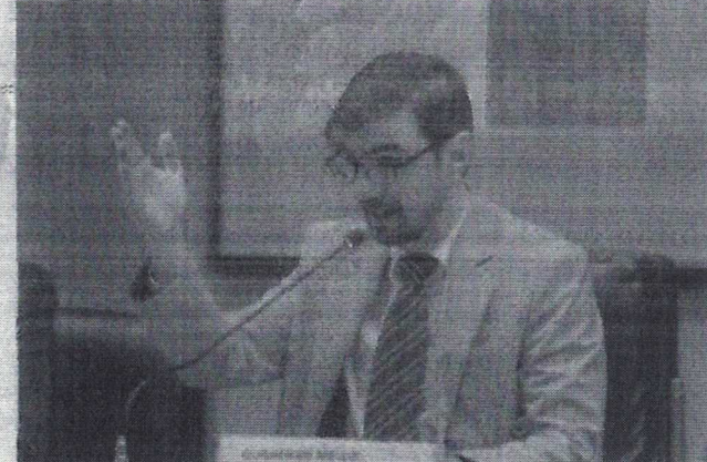
SECRETÁRIO de Política Econômica do Ministério da Fazenda, Guilherme Mello

O secretário de Política Econômica do Ministério da Fazenda, Guilherme Mello, disse ontem, 18, que a discussão sobre alteração na escala 6x1, como colocada no Congresso, refere-se mais ao bem-estar físico e mental dos trabalhadores do que a questões de produtividade - e que os efeitos econômicos de eventual mudança precisam ser vistos com cuidado. "Quanto aos efeitos econômicos