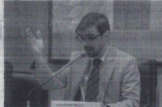
SECRETÁRIO de Política Econômica do Ministério da Fazenda, Guilherme Mello

O secretário de Política Econômica do Ministério da Fazenda, Guilherme Mello, disse ontem, 18, que a discussão sobre alteração na escala 6x1, como colocada no Congresso, refere-se mais ao bem-estar físico e mental dos trabalhadores do que a questões de produtividade – e que os efeitos econômicos de eventual mudança precisam ser vistos com cuidado.